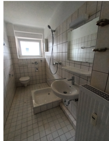
Tageslichtbad mit Dusche